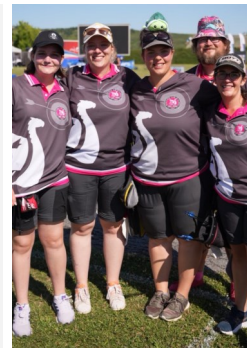
Double Championne de France de Division 1